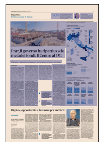
Peso: 1-7%, 3-66%

muovono neanche i primi passi. Nel messaggio dei costruttori, oltre al dato territoriale, c'è proprio questo elemento di profonda preoccupazione per quel 49% di fondi - 52,5 miliardi - che bisogna ancora distribuire sul territorio. Sappiamo quanto sia complicata in Italia la programmazione territoriale, il passaggio cioè dai fondi centrali alle casse regionali e poi comunali e come questo richieda una spinta fortissima già dall'inizio, dal ministero competente che deve portare il programma all'approvazione passo dopo passo. Uno dei grandi rischi di ritardo nell'attuazione del Pnrr è proprio la «territorializzazione» che